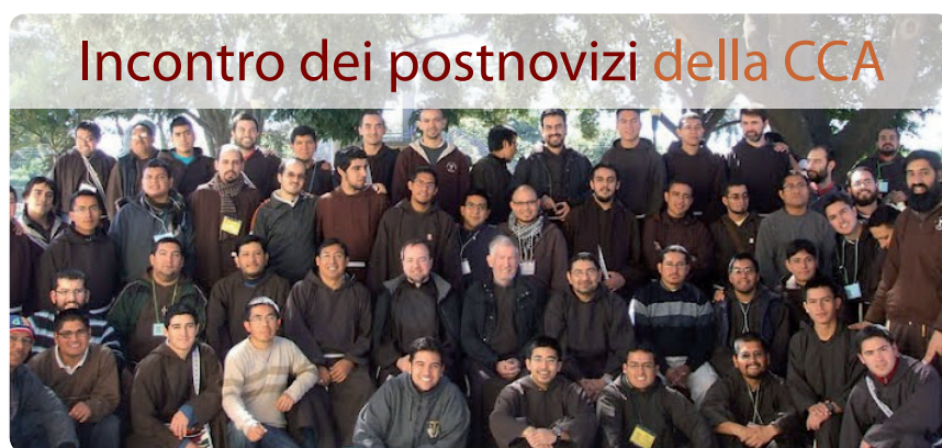
Incontro dei postnovizi della CCA

S ANTA CRUZ, Bolivia – Dal 15 al 28 luglio si sono riuniti nella località di “El Naranjal” nella periferia di Santa Cruz de la Sierra, i fratelli postnovizi di tutta la Conferenza Cappuccina Andina. Insieme a loro c’erano anche i rispettivi formatori come segno di accompagnamento fraterno. L’idea è sorta dal gruppo dei postnovizi della Provincia di Colombia, che erano stati presenti ad una riunione dei Ministri della CCA quasi due anni fa. L’intenzione era quella di poter avere un’occasione comune di incontro e di formazione. I Superiori maggiori facendo propria l’idea proposero un periodo di 15 giorni, dei quali la prima settimana sarebbe stata dedicata alla formazione interna, alla convivenza fraterna e alla preghiera contemplativa; mentre la seconda settimana sarebbe stata “in