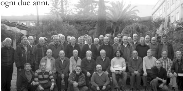
Incontro dei Superiori locali della CIC

V EDAT de TORRENTE (Spagna) - Costituzioni, nostro progetto di vita era il tema dell'incontro dei Superiori locali della Conferenza Iberica che si è svolto nei giorni 3-8 novembre nella Casa di esercizi e spiritualità “Santo Domingo de Guzmán” a Vedat de Torrente (Valencia). L'incontro si proponeva di dare un valido aiuto a tutti i frati in un momento nel quale l'Ordine cappuccino è impegnato nella revisione della sua legislazione (Costituzioni e Statuti generali). Fra i conferenzieri, per citare i più conosciuti, ricordiamo fr. Miguel Anxo Pena, membro della Commissione per le Costituzioni, e fr. Francisco Iglesias. La Conferenza Iberica dei Cappuccini (CIC) esiste da più di mezzo secolo. Fin dall'inizio le sei Province cappuccine di Spagna e Portogallo, che la compongono, hanno collaborato in varie forme, tramite incontri, gruppi di lavoro e convegni. Una delle attività che più si sono affermate è stata quella delle Riunioni dei Superiori locali di tutte le fraternità della Conferenza; riunioni alle quali partecipano anche i Ministri provinciali e i loro rispettivi Definitorii. Organizzate dalla Commissione dell'Animazione fraterna, si tengono ogni due anni.