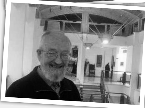
Papa Francesco dalle Clarisse: "Dove si prega per il Papa"

CASTEL GANDOLFO, Italia - 14 Luglio, mentre trascorreva in pieno la visita del Papa Francesco a Castel Gandolfo, una voce al telefono avvisa le suore Clarisse che vivono nel monastero a Castel Gandolfo la possibilità che il Santo Padre passi da loro prima di recarsi dai suoi confratelli gesuiti. Passa poco tempo e, per la prima volta, le pianticelle di Francesco d'Assisi, con gioia immensa vedono entrare in loro giardino il Papa Francesco, per il quale, questo gruppo di monache prega, in questa particolare Villa Pontificia. Le prime parole del Papa sono di sorpresa nel vedere la comunità più numerosa e giovane di quanto avrebbe potuto immaginare. Le suore sono meravigliate dalla sua cordialità, umanità e affabilità di modi e dalla particolare tenerezza riservata alle sorelle più anziane e deboli. Percorrendo il corridoio, il Papa sosta in preghiera silenziosa davanti alla lapide che segnò la storia del monastero quando, durante la seconda grande guerra, il 1° febbraio 1944, un bombardamento rase al suolo gran parte del monastero togliendo la vita subito a quindici giovani suore, seguite pochi giorni dopo altre tre.