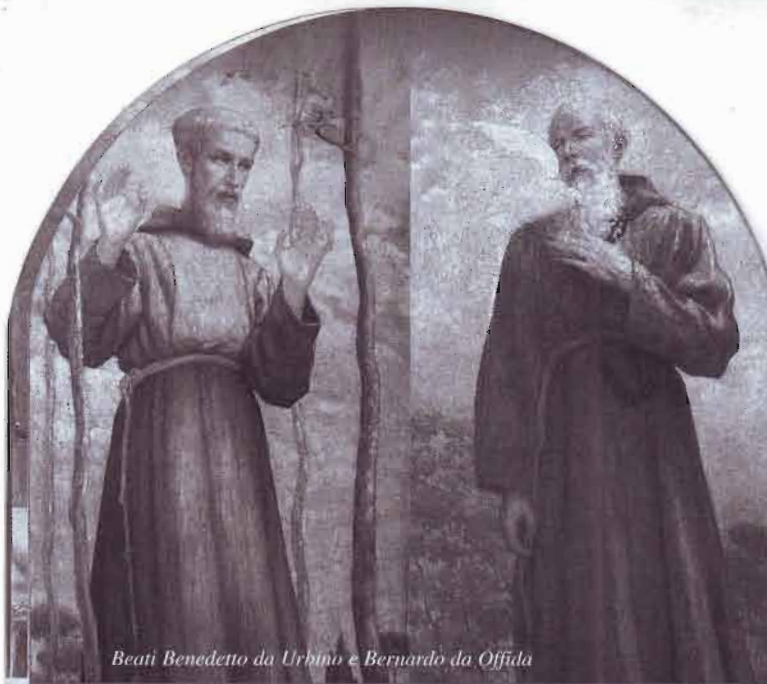
Beati Benedetto da Urbino e Bernardo da Offida