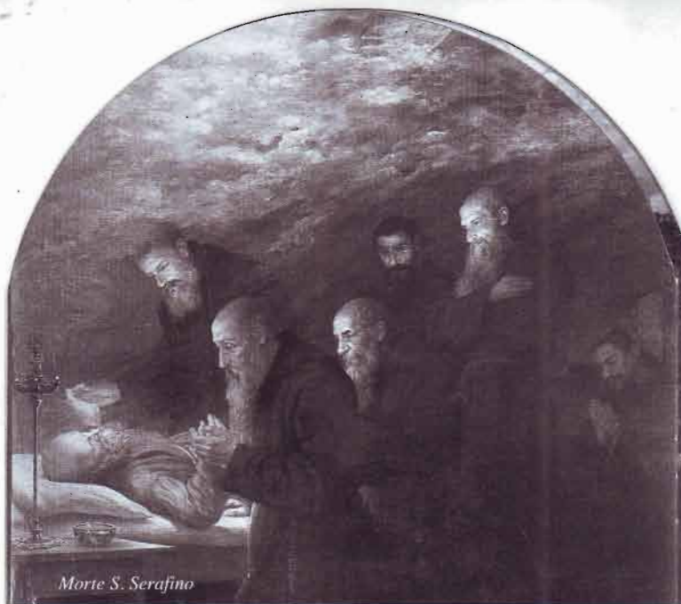
Morte S. Serafino