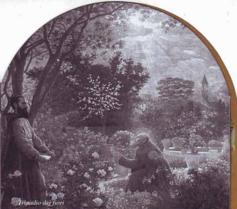
Tribudio dei fiori