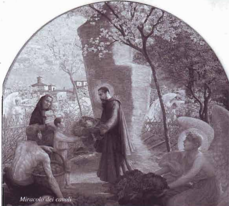
Miracolo dei cavoli